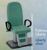
Poltrona Liberty chair