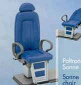
Poltrona Sonne chair