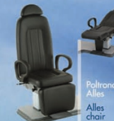
Poltrona Alles chair