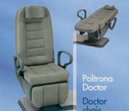
Poltrona Doctor chair